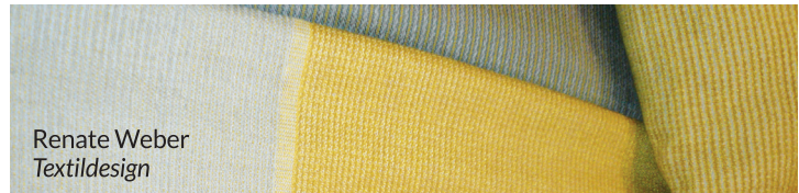
Renate Weber Textildesign